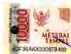
Anggoro Aji Pamungkas