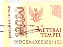
Rizaldy Ikhwan Kosasih