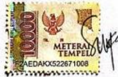
Nur Syifa Laila