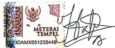
Desi Tri Adesti