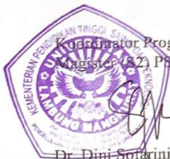
Koordinator Program Studi Magister (S2) PSDAL