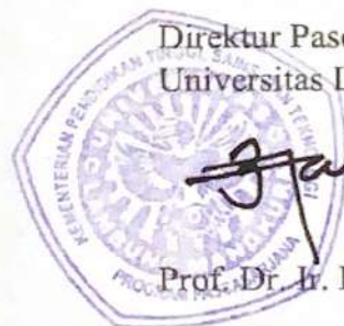
Direktur Pascasarjana Universitas Lambung Mangkurat