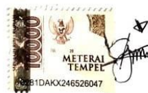
Vega Centauri Manikome