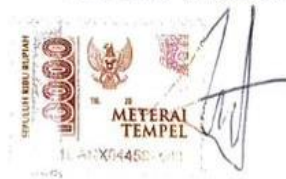
Zulfira Nur Fitria