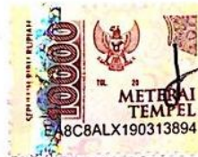
Intania Junita Utami