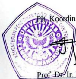
Plt. Koordinator Prodi S2 PSDAL