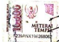
Fara Nurlaila Wahida