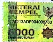
Dayu Hidayat NIM. A1D113285

Banjarbaru, 6 September 2018 Yang membuat pernyataan