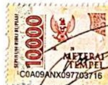
Windie Nur Aini